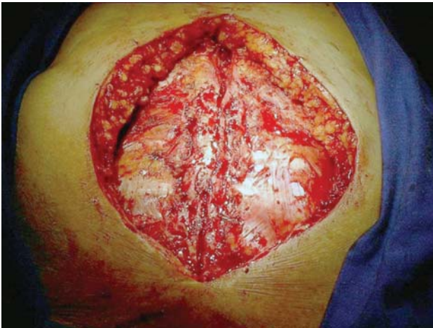
Fig. 2 - Defeito na parede torácica

As culturas foram realizadas pela coleta semanal de fragmentos de tecido durante a realização dos curativos. Nas culturas foram isolados os seguintes germes: S. aureus (5 casos), E. coli (1 caso), S. epidermidis (1 caso) e P. aeruginosa (1 caso). Até o início da antibioticoterapia, específica pelo antibiograma, iniciou-se esquema antibiótico empírico de amplo espectro, com vancomicina e cefepime, em todos os pacientes.