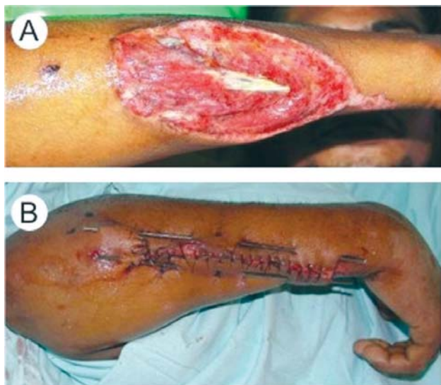
Fig. 1 - A: Ferimento elíptico; B: Retificação das bordas com hastes metálicas

Em cirurgia plástica, os defeitos miocutâneos têm sido tratados utilizando-se hastes metálicas como redutoras de tensão das bordas da ferida, de modo a permitir a sua sutura convencional, como demonstrado nas Figuras 1A e 1B [5].