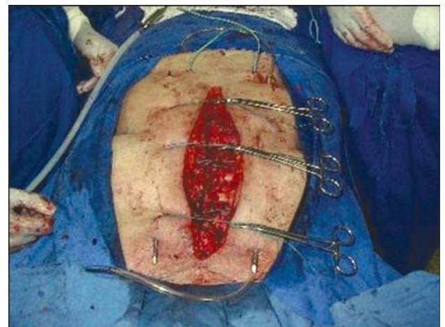
Fig. 4 - Aproximação dos bordos com pontos totais ancorados nos fios de Kirschner