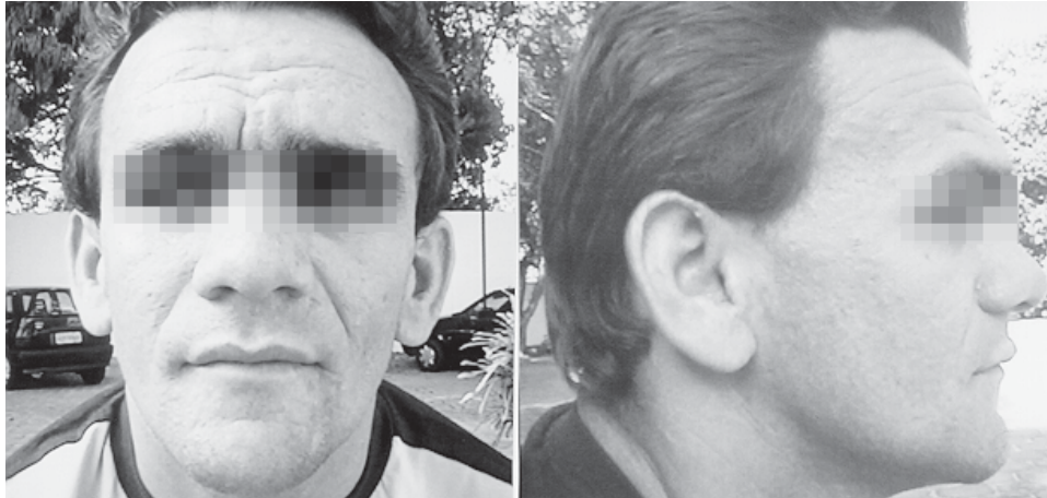
Figura 1 – Vista frontal e em perfil do paciente: notar a proeminência da região frontal, o alargamento da base do nariz e o rash eczematóide característicos da “face do Jó”.