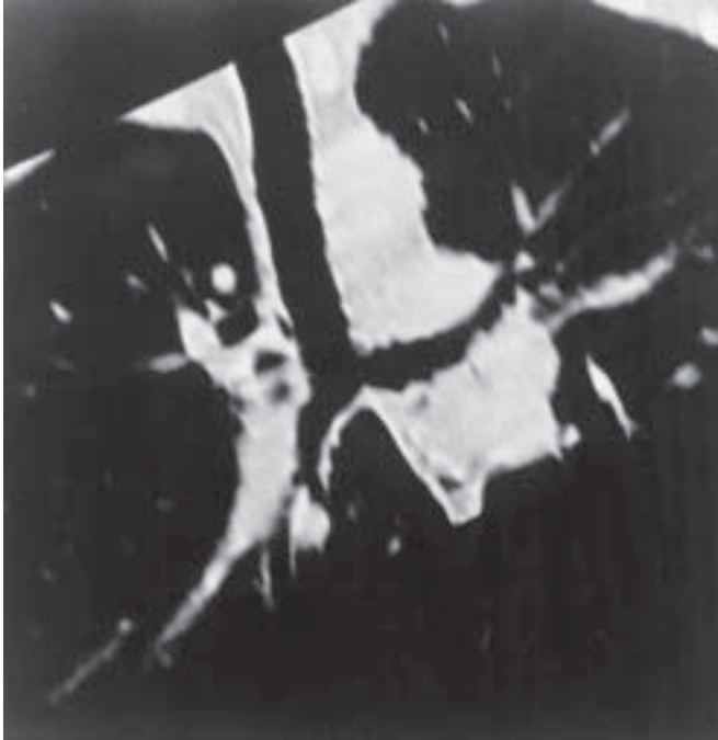
Figura 3 – Broncoscopia virtual evidenciando o resultado final pós-reconstrução da carina e brônquios principais

no pré-operatório para 1,78L no pós-operatório. A paciente voltou a exercer suas atividades habituais de dona-de-casa.