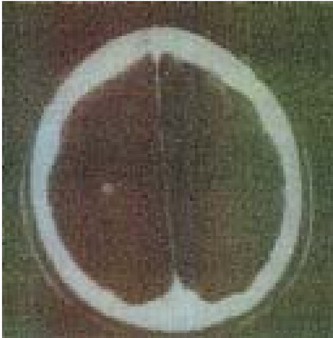
Figura 1 – Formação hipodensa, de contorno digitiforme, com captação nodular central do meio de contraste, localizada nos lobos frontoparietais direitos, medindo 5,5 x 4,8cm. A lesão determinava apagamento dos sulcos e fissuras cerebrais adjacentes sem desvio da linha média. Sistema ventricular e cisternas da base anatómicas. Fossa posterior sem anormalidades. Lesão expansiva frontoparietal direita de aspecto neoplásico (lesão metastática?)

ponde a 5% dos casos notificados de TB (4) . Nos países industrializados essa forma corresponde a 0,15% a 0,18% dos casos (5) .