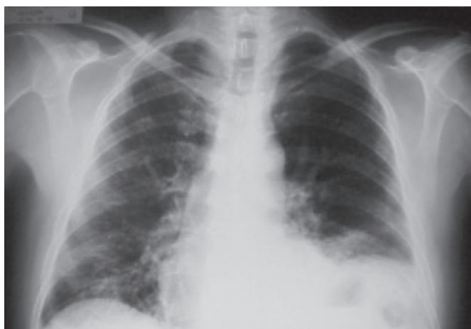
Figura 2 – Radiografia frontal de tórax – cinco dias após figura 1. Elevação de cúpula frênica esquerda associada a consolidação basal. Há opacidades lineares em base direita.