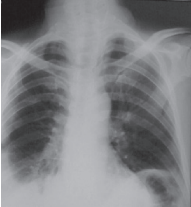
Figura 4 – Radiografia frontal de tórax – 38 dias após figura 3. Moderado derrame pleural à direita. Elevação de cúpula diafragmática esquerda. Regressão praticamente completa da consolidação em base esquerda.

foram solicitadas sorologias para diversas patologias, apresentando-se positiva para a toxoplasmose, com IgG = 254UI/ml e IgM = 8,81UI/ml. Não houve conduta terapêutica para polimiosite. O paciente apresentou melhora do quadro clínico ao ser introduzida sulfadiazina – 4g/dia, piremetamina – 50mg/dia e ácido fólico, tendo alta hospitalar e controle ambulatorial satisfatório.