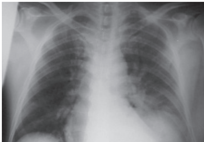
Figura 1 – Radiografia frontal de tórax. Elevação de cúpula diafragmática esquerda. Opacificação da base pulmonar esquerda em parte do LIE.